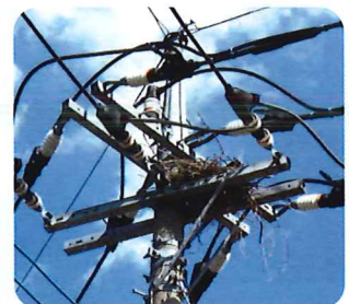
カラスの巣がある