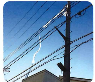
電線にビニールが 引っかかっている