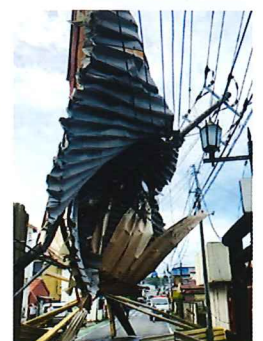
2019年台風15号襲来時の実際の被害の様子

切れた電線や電柱・電線に引っかかっているビニールや樹木等を 発見された場合は、東京電力パワーグリッドまでご連絡ください