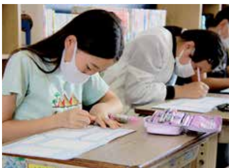
【夢の実現のために(高根)】

夫を凝らして感想を伝えていました。自分の夢を叶えた、それぞれの先生の話や実際にプロとして戦っている映像を見て感化された児童たちは、じっくりと自分の将来について考えることができました。最後に、数人の児童が先生やクラスメイトの前で将来の夢を発表しました。その発表では、自分の夢にどうすれば近づけるのかの説明もしていました。