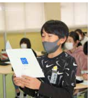
【先生の前で発表(八積)】