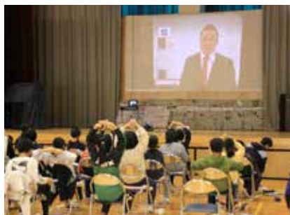
【先生の質問に大きな〇(一松)】