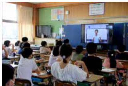
【真剣に話を聞く児童(高根)】

新型コロナウイルス感染症対策のため、オンライン授業での開催でしたが、児童たちは講師の先生のお話を真剣に聞いていました。画面越しの授業なので、児童は黙ってうなずいて聞くだけでなく、大きく丸を作って返事をするなど、工夫を凝らして感想を伝えていました。