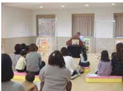
【子育てルームでのおはなし会の様子】

新型コロナウイルス感染予防対策のため電話予約制となりましたが、多くの親子連れが参加し、クリスマスにちなんだ紙芝居や絵本を聞いて楽しいひと時を過ごしました。