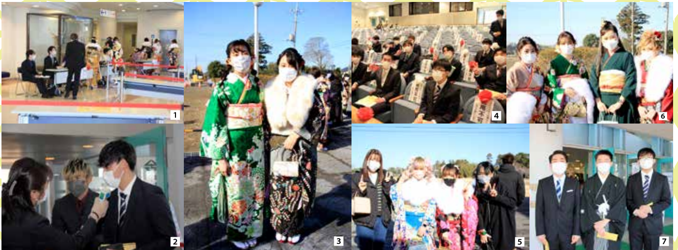
1受付はテーブルで列ごとに区別 2入場時は体温測定 3きれいな振袖を身にまとい嬉しそう 4密にならないよう席を空けて着席 5今年は家族も一緒に式典に参加できました 67久しぶりの友人との記念撮影