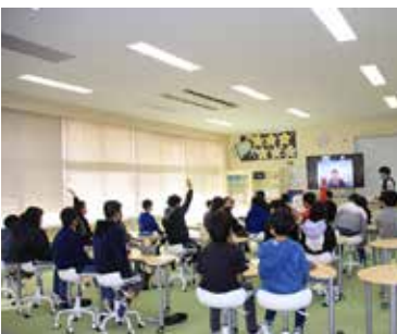
【元気よく手を挙げて質問(八積)】

新型コロナウイルス感染症対策のため、オンライン授業での開催でしたが、児童たちは講師の先生のお話を真剣に聞いていました。画面越しの授業なので、児童は黙ってうなずいて聞くだけでなく、大きく丸を作って返事をするなど、工夫を凝らして感想を伝えていました。