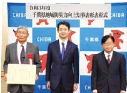
【左から木島会長、熊谷知事、鈴木理事長】