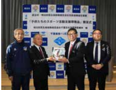
【橋本支社長から小高村長へボールの贈呈】