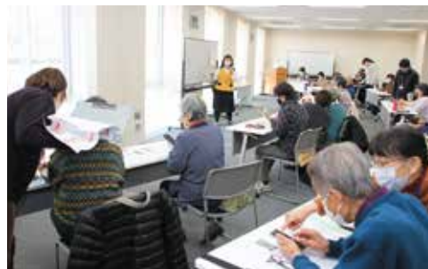
【サポートの職員に聞きながら操作する受講者】

講座の内容は、基本的な操作や知っておくと便利な機能などでした。受講者たちはぎこちない手つきでしたが、一生懸命操作を学んでいました。