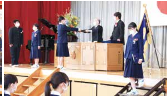
【校長先生から卒業証書授与】