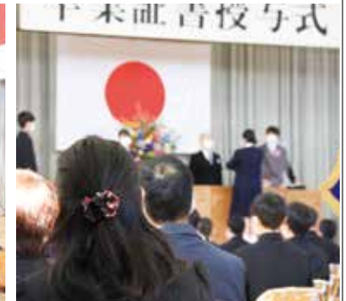
【我が子の門出を見守る保護者】