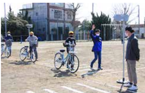
【児童同士で確認し合います】

正しい自転車の乗り方について学習した後、グラウンドに作成した模擬道路で、確実な安全確認や安全走行等が出来るよう実技演習が行われました。