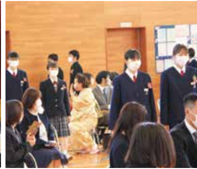
【保護者に見守られ入場する卒業生】