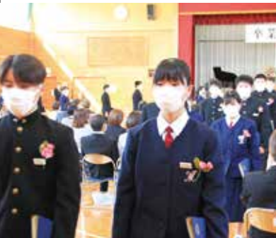
【思い出を胸に退場する卒業生】