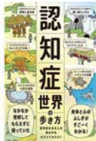
認知症世界の歩き方