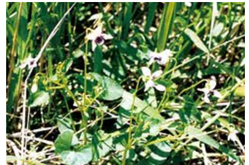
長生・尼ヶ台湿地植物を守る会