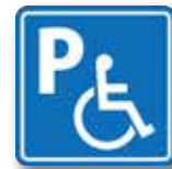
【車いす使用者優先駐車場画】