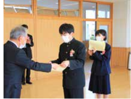
【長生中学校での表彰】

今年度は、スポーツや文化の功労者として、長生中学校から134人、八積小学校から37人、高根小学校から21人、一松小学校から16人が表彰されました。