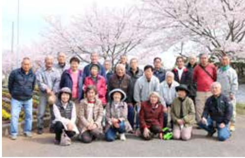
【素敵な桜の時期に受賞されました】

台風等の自然災害に備えて枝打ちや、病気にかかった樹木の保護などたくさんの活動を行っています。