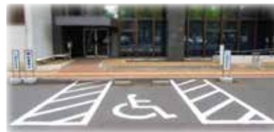
【おもいやり駐車場画】