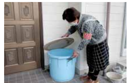
【実際の活動の様子】

社会福祉協議会では、ゴミ出しのボランティア活動に参加して下さる人を随時募集しています。