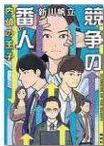
競争の番人2 内偵の王子 新川 帆立(著)