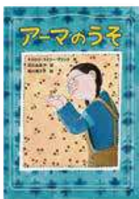
アーマのうそ キャロル・ライリー・ブリンク(作)