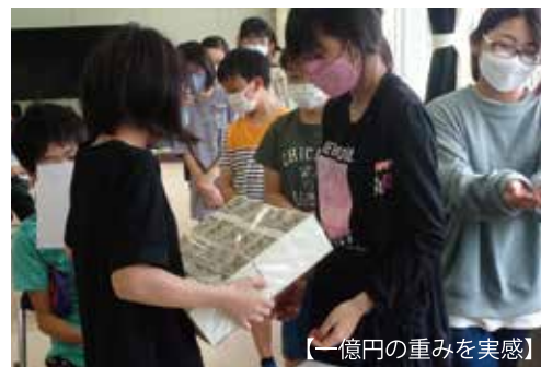
【一億円の重みを実感】