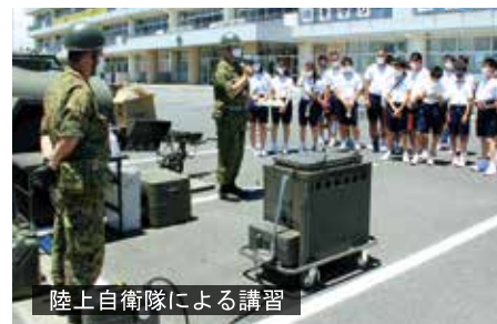
陸上自衛隊による講習