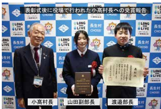
表彰式後に役場で行われた小高村長への受賞報告