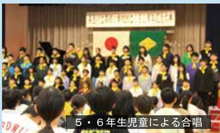
5・6年生児童による合唱