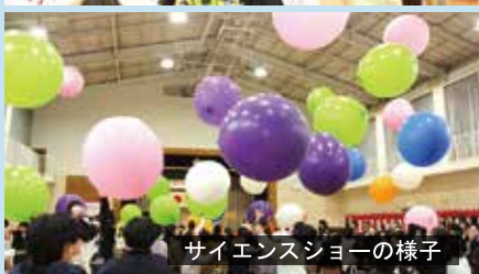
サイエンスショーの様子

12月15日、「高根小学校創立150周年記念式典」が高根小体育館で行われました。