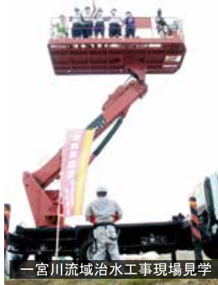
一宮川流域治水工事現場見学

長生中防災部は、災害時に率先して地域に貢献できる中学生の育成を目指し、令和3年6月に設立。村の避難訓練への協力や一宮川流域治水工事現場の見学、自衛隊から防災に関する知識を学ぶなど、日々の活動による地域防災力の向上が評価されました。