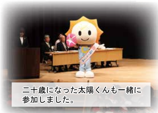
二十歳になった太陽くんも一緒に参加しました。