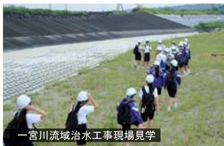
一宮川流域治水工事現場見学