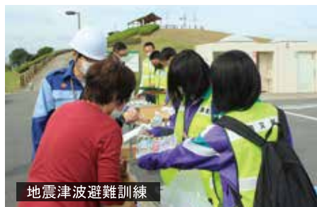
地震津波避難訓練