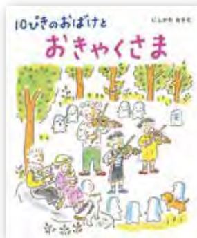
『10ぴきのおばけと おきやくさま』 にしかわおさむ(作・絵)