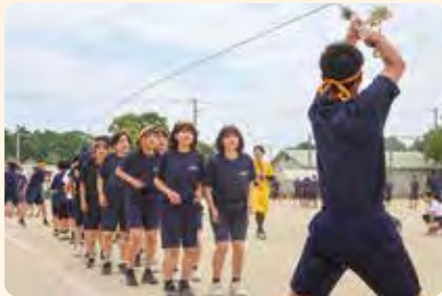
学級対抗大縄跳び

今年のテーマは「百花繚乱～咲き誇れわれらの青春～」で、生徒たちは全力で競技に挑み、青春の汗を流していました。激戦の末、総合優勝を果たしたのは黄団で、大いに盛り上がった応援合戦では青団が優勝しました。