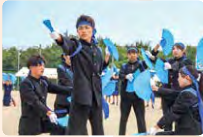
応援合戦 優勝:青団

村には日々、色とりどりの“できごと”が降りそそいでいます。その“できごと”が村にうるおいをもたらしてくれています。今月も、そんな“できごと”の一部をご紹介します。