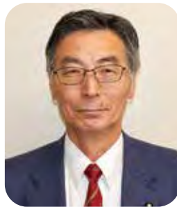
関 克也 議員(10期)