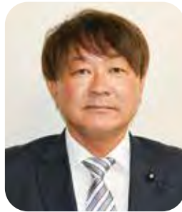
岡本 高直 議員(3期)