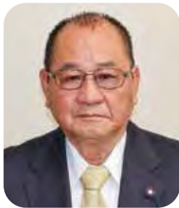
東間 永次 議員(10期)