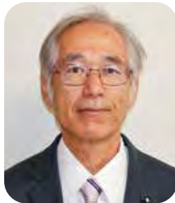
大矢 信治 議員(1期)