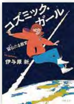
『コズミック・ガール 宙わたる教室』 伊与原新(著)