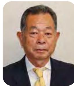
石井 俊雄 副議長(4期)