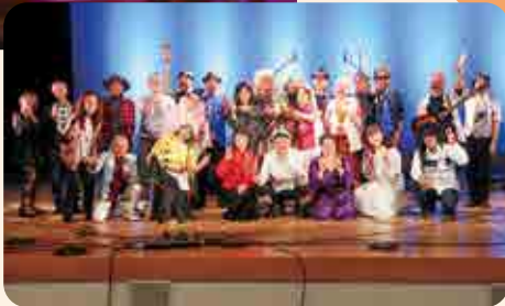
出演者の集合写真