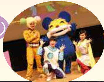
左から ダンゴン カイセイ ニャンちゅう コネル