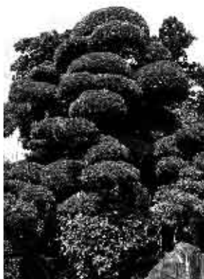
村の木「ラカンマキ」