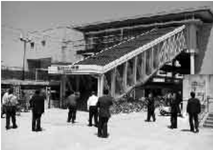
国府多賀城駅を視察