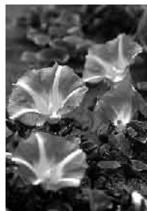
村の花「ハマヒルガオ」