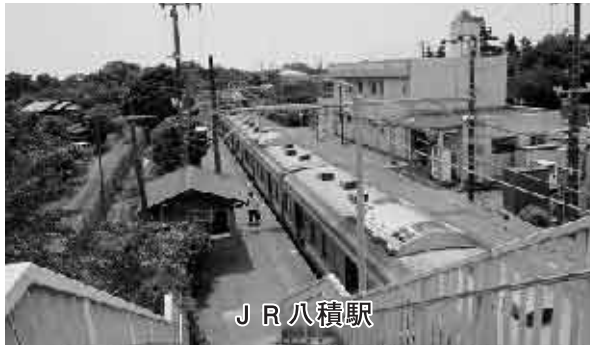
J R 八積駅