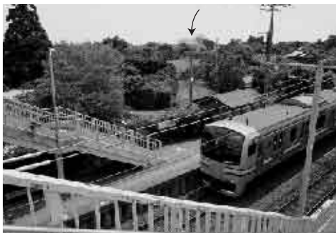
跨線橋から文化会館を望む

本年度は住民懇談会、策定住民会議、中間報告（議会・審議会）まで実施する予定です。平成22年度中に完成させ平成23年度から平成32年度まで第5次総合計画が実施される予定です。