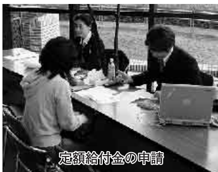
定額給付金の申請

議員 平成21年度予算概 要書によれば、前 年度なみの歳入の維持が困難 とあり、新たな財源確保が必 要とされています。