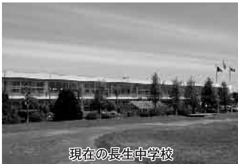
現在の長生中学校

なお、委員会ではこれまで改築の建設スケジュール、規模、構造、仮校舎問題、エコエネルギー対策、解体計画、基本設計、実施設計、工事発注等、様々な検討をしました。