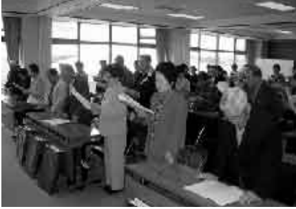
老人クラブ連合会総会