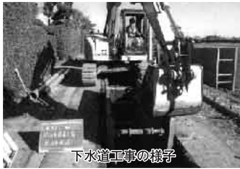
下水道工事の様子