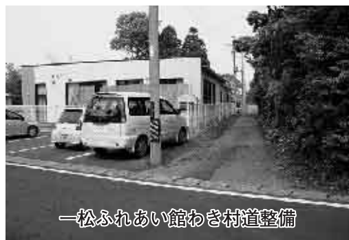
一松ふれあい館わき村道整備

また生活排水対策として長生 中学校東側、岩沼地先排水対 策事業などを3月補正予算に 計上しました。