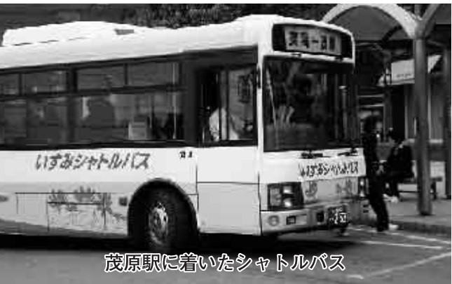
茂原駅に着いたシャトルバス

企画財政課長 関係各課と協議し、さらに新たな協議会等を立ち上げ、地域の公共交通のあり方、村の方向を考えていきたい。