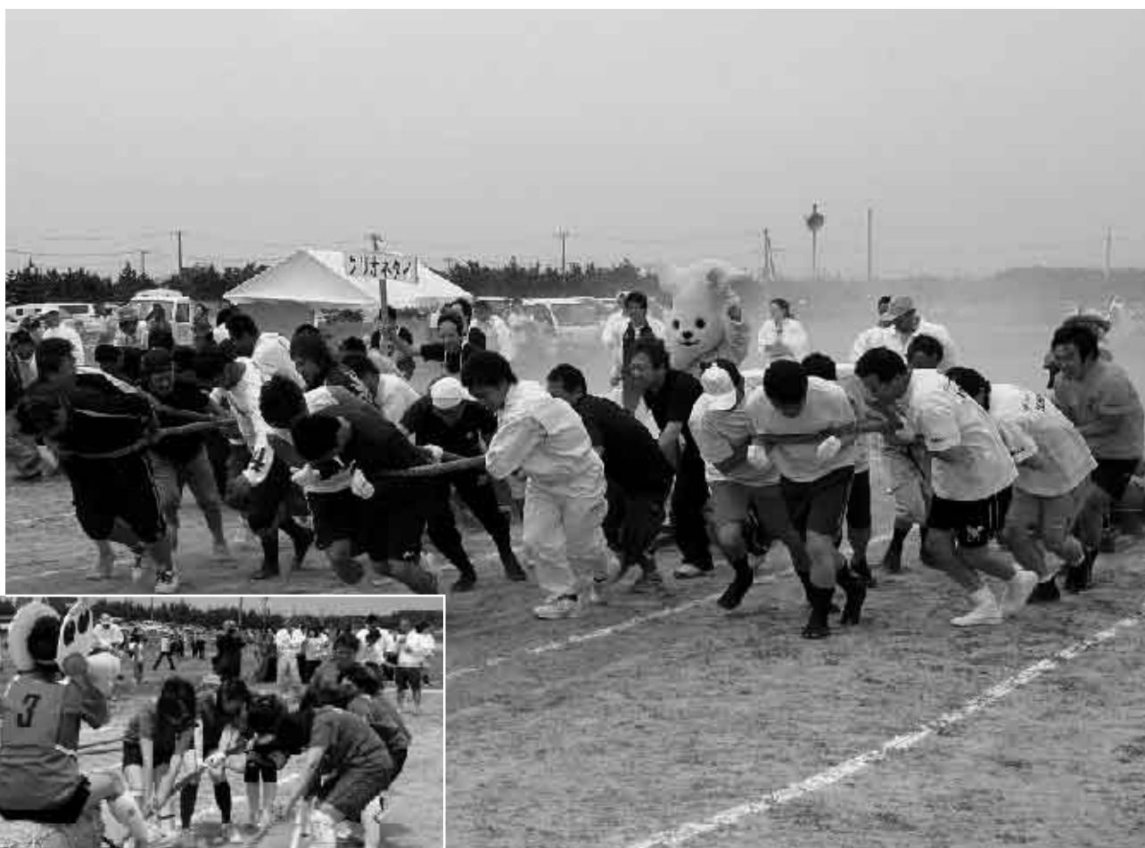
人間ばん馬大会「今年のソリは重かった」