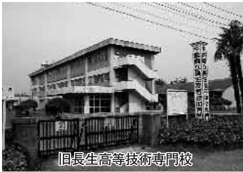
旧長生高等技術専門校