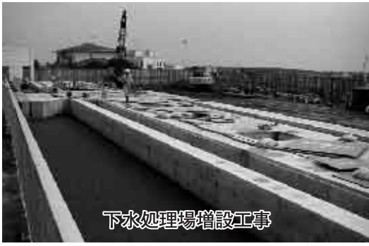
下水処理場増設工事

内容は、提案するにあたり、長生浄化センターの建設工事委託に関する基本協定の見直しを行い、21年度実施協定の電気設備工事、場内整備工事、日本下水道事業団の管理諸費等を合わせて300万円の減額となったものです。