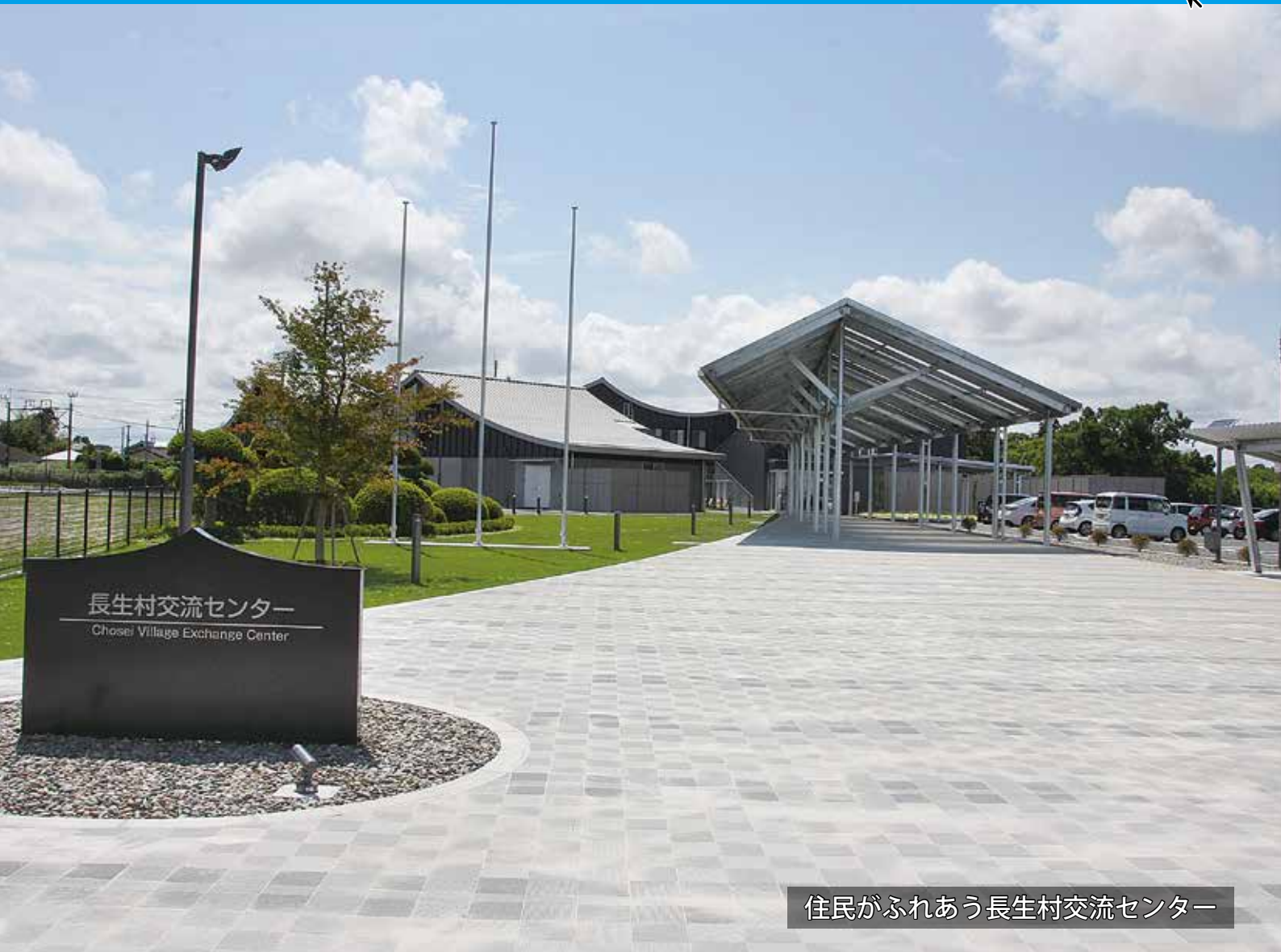
住民がふれあう長生村交流センター