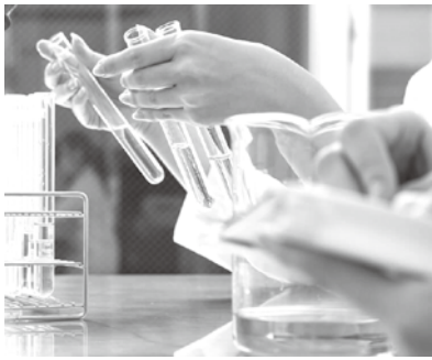
PCR検査の様子の一部