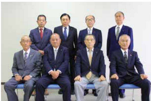
新しい議会だより編集特別委員会委員

長生村議会事務局 TEL:32-4744 FAX:32-1177 メールアドレス: cho-gikai@vill.chosei.lg.jp