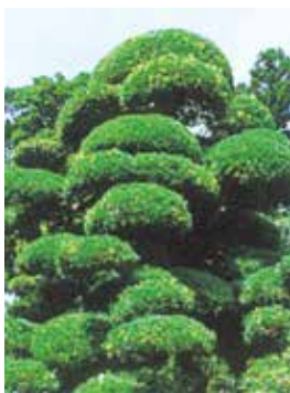
村の木「ラカンマキ」