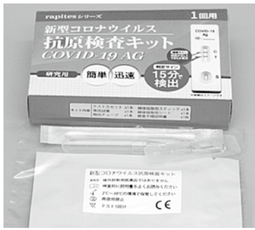
新型コロナウイルス抗原検査キット

感染が広がっている地域 に通勤・通学する村民に対 し、いつでも希望に応じて PCR検査を行うよう提起 したいが、村の見解を聞き ます。