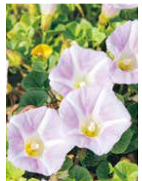
村の花「ハマヒルガオ」