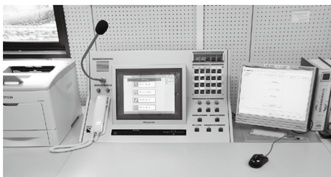
防災行政無線メディア連携装置